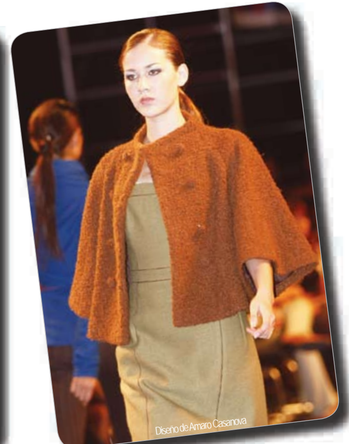
Diseño de Amaro Casanova