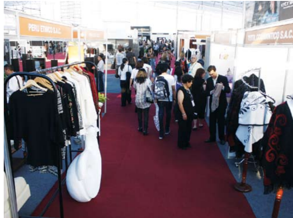
450 expositores en Peru Moda, en los 17 mil metros cuadrados de exposición

Cabe mencionar que la industria tuvo un importante crecimiento en el 2008 y ahora son 1,889 empresas del sector, 199 más que las registradas en el 2007.