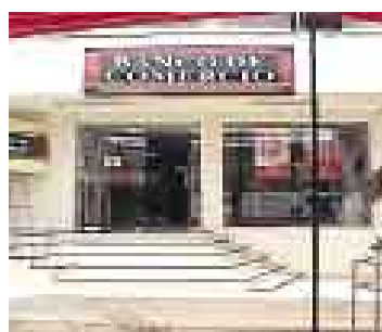
FINANCIAMIENTO. Pymes obtendrán nuevo tipo de créditos.

CONTÁCTENOS. Envíenos las novedades sobre su empresa a piqueoempresarial@comercio.com.pe. Los datos para la edición del día siguiente se reciben solo hasta las 2 p.m. El Diario se reserva el derecho de seleccionar y editar las notas.