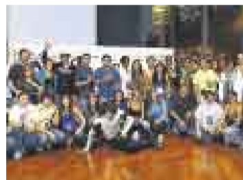
PREMIADOS. Ganadores del sorteo vieron de cerca a la banda Kiss.

terreno de 11.000 m², proveerá alrededor de 15.000 ítems para la construcción, jardinería, gasifería, electricidad, entre otros. En los últimos cinco años, la empresa ha triplicado su área de ventas y ha facturado en el 2008 una suma global de S/.700 millones.